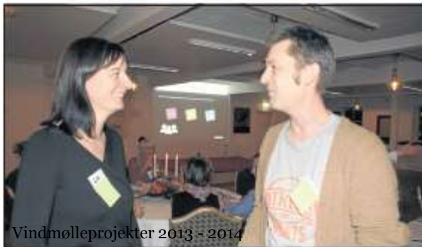
Vindmølleprojekter 2013 - 2014